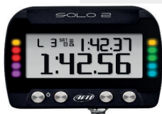
GPS lap timer