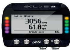
GPS lap timer a dataloger

GPS lap timer s integrovanou databází tratí, trojosý +-5G akcelerometr + 3 axis gyro + 3axis magnetometer, 4 GB vnitřní paměť, dobíjecí baterie, magnetické upevnění.